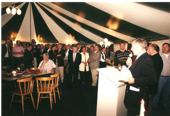
Gezelligheid in de VIP tent, maar zónder PSV!

Tijdens dat 50-jarig bestaan wordt op het trainingsveld door Van Workum een VIP-tent geplaatst die met de nodige pracht en praal wordt aangekleed.