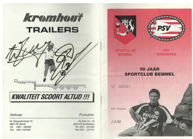
Programaboekje "50 jaar SPORTCLUB BOMMEL"

gement kopen inclusief een entreekaart voor de hoofdtribune en na afloop een hapje en drankje in de speciaal hiervoor neergezette VIP-tent.